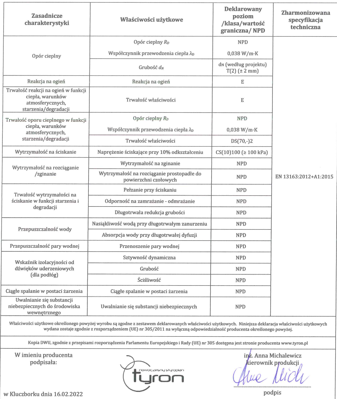
Tabela 1 Deklarowane Właściwości Użytkowe: